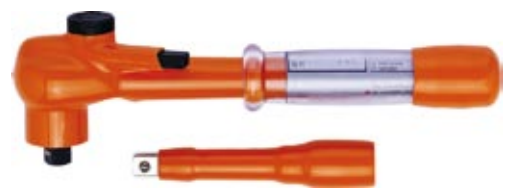
Das Klauke Handwerkzeugprogramm erweitert sich um den Bereich der vollisolierten Werkzeuge.