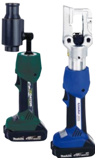
Egal ob Sie mit der Greenlee Akku-Handlochstanze (links) oder der neuen Klauke mini+ (rechts) arbeiten, Sie erhalten die Geräte mit leistungsstarken Lithium-Ionen-Akkus

Klauke entwickelt, fertigt und vertreibt qualitativ hochwertige Werkzeuge für die Elektrotechnik. Die von Klauke vertriebenen Produkte sowie die umfassende Servicekompetenz genießen weltweit Anerkennung.